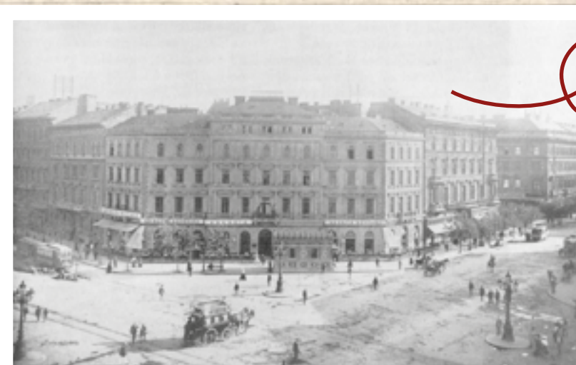
Mikszáth egyik törzshelye, az Abbázia kávéház 1900 körül