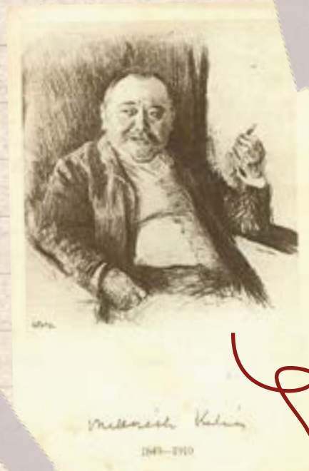
Glatz Oszkár: Mikszáth Kálmán, 1906.

A másik tábor szerint azonban a különös nyelvi megformáltság azért szükséges tartozéka bármilyen valamirevaló írói alkotásnak, mert egy irodalmi mű esetében nem csak az számít, hogy milyen történetet beszél el, hanem az is, hogy hogyan teszi ezt.